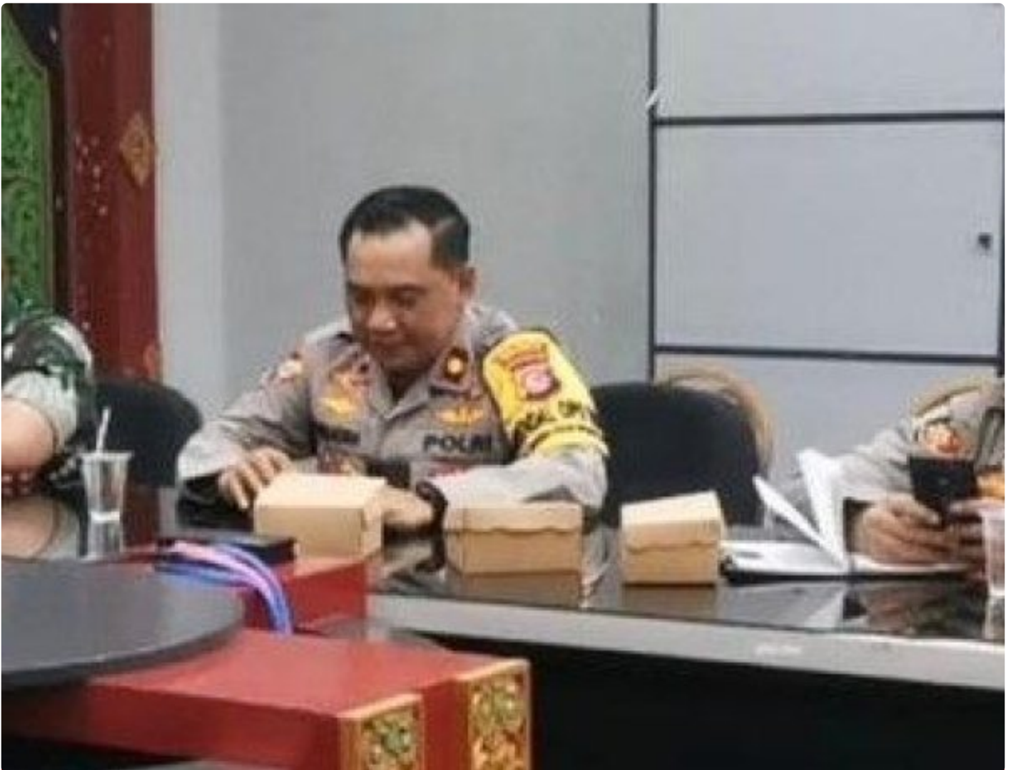
Kabagops Polresta Mataram saat menghadiri Rakor di Kantor Bupati Lombok Barat, Selasa (10/12/2024)